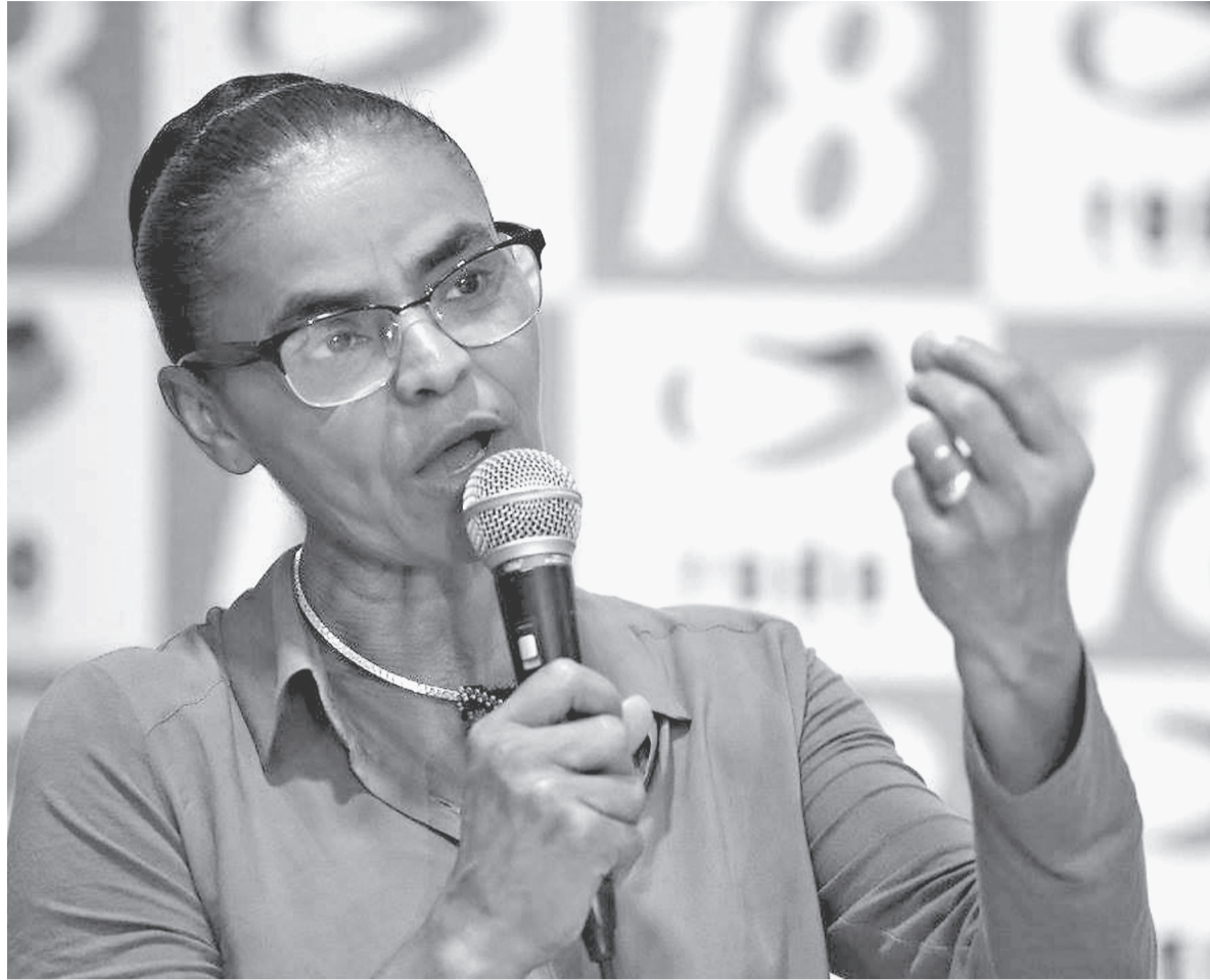
所属する政党主催のイベントで講演するマリナ・シルバ氏(上)とブラジルのサンパウロ市で2016年6月、レオ・カララ氏撮影